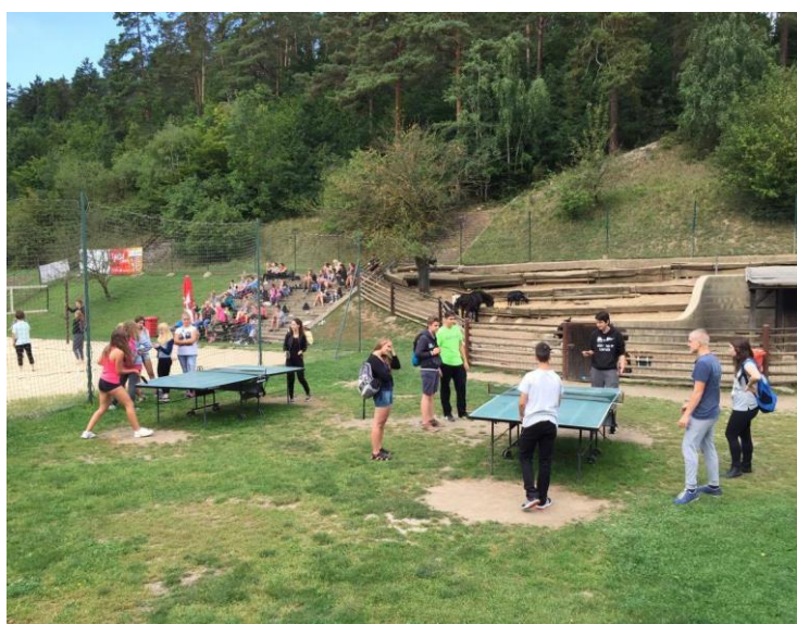
Žáci prvních ročníků při hraní stolního tenisu.

Dne 2. září 2016 se uskutečnil adaptační den pro 1. ročníky ve sportovním areálu Eldorado v Mariánském údolí. Akce se zúčastnilo 150 žáků a 8 pedagogů. Žáci soutěžili v přehazované, ve vědomostním běhu družstev a psychomotorické a pohybové hře. Dále mohli využít trampolíny, stolní tenis a petanque. Na závěr proběhlo vyhodnocení a ocenění nejlepších tříd.