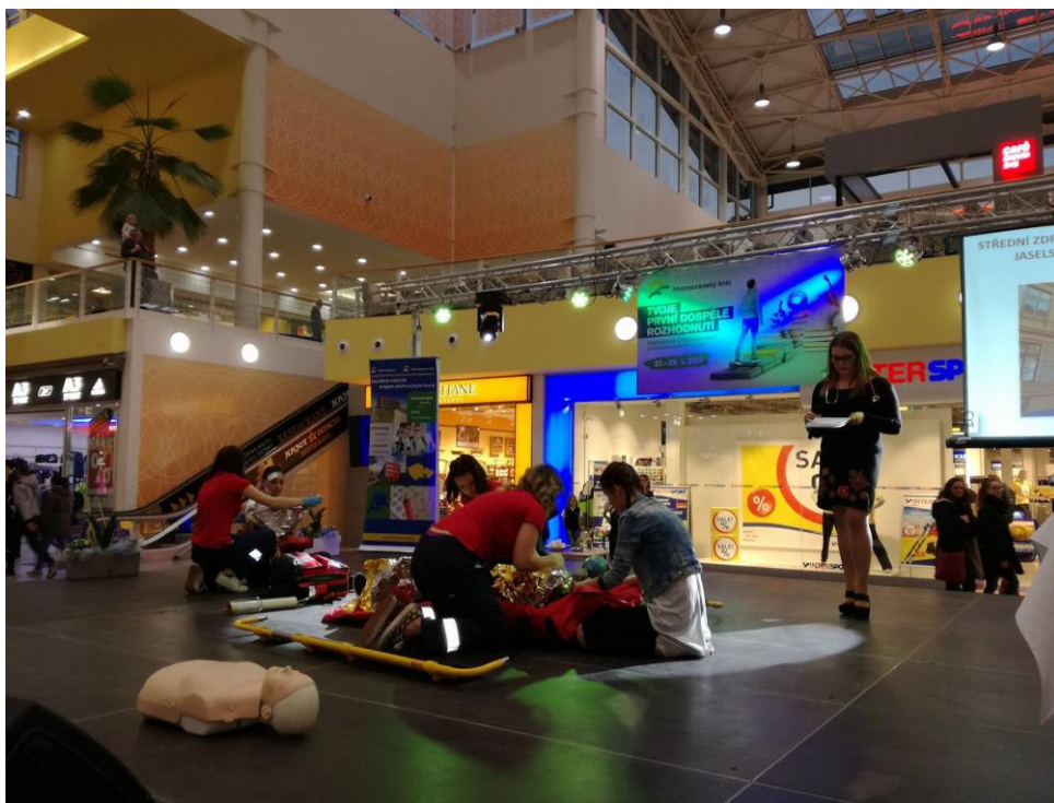
Předvedení první pomoci