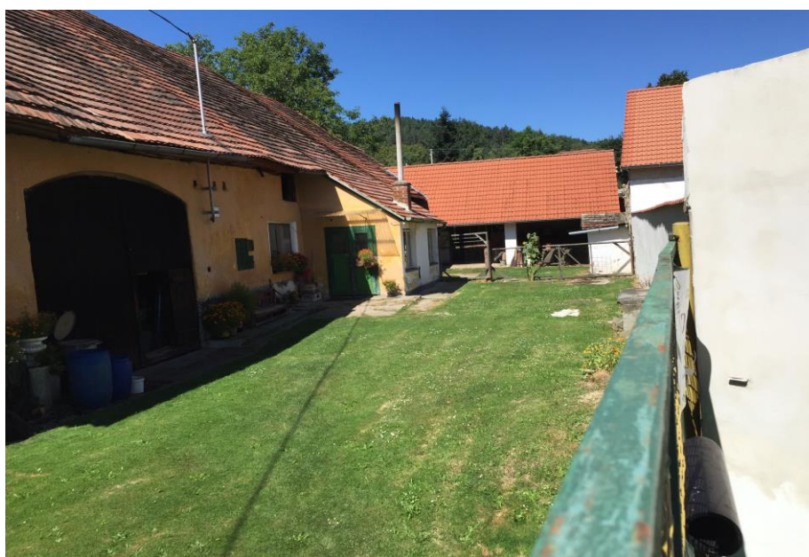
Dům Konopníkových – foceno s nasazením života – musel jsem se jako agent proplížit kolem domu Škopkových a nenápadně prostrčit ruku přes vysoký plot

Zajímavostí jistě je, že v Hošticích nenajdete úplně všechny filmové lokace, protože režisér Troška použil i sousední vesnici pro natáčení scén s farářem Otíkem (jeho fara právě leží mimo Hoštice) a slavná nudistická pláž se nachází rovněž mimo Hoštice za kopcem u lesa.