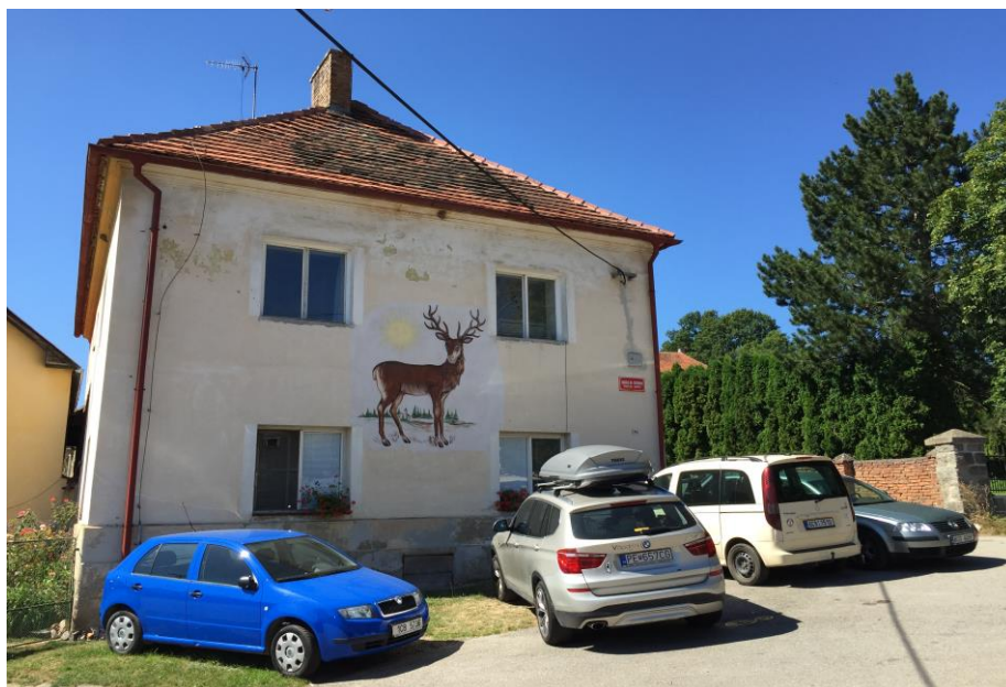
Dům starosty s freskou jelena