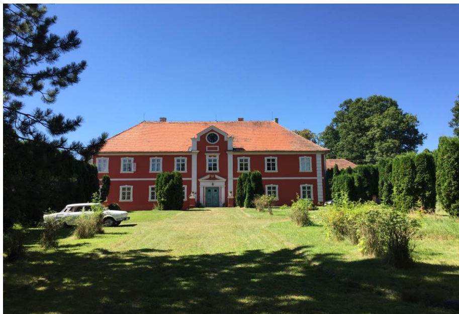
Hoštický zámek v novém kabátu

jsou vzrostlé, přibylo mnohem více aut na náměstíčku, pouze jediný obchod se suvenýry široko - daleko), ale ihned jsem poznal, že jsem na místě, kde se psala česká filmová historie. Musím ovšem uznat, že ve filmech vypadá náves podstatně větší. Sympatické na Hošticích je, že pokud dorazíte na hlavní malé náměstí, ocitáte se přímo v centru veškerých filmových událostí. V okruhu 150 metrů můžete najít zámek, hřbitov s kostelem, starostův dům s jelenem, domky Škopků a Konopníků atd.