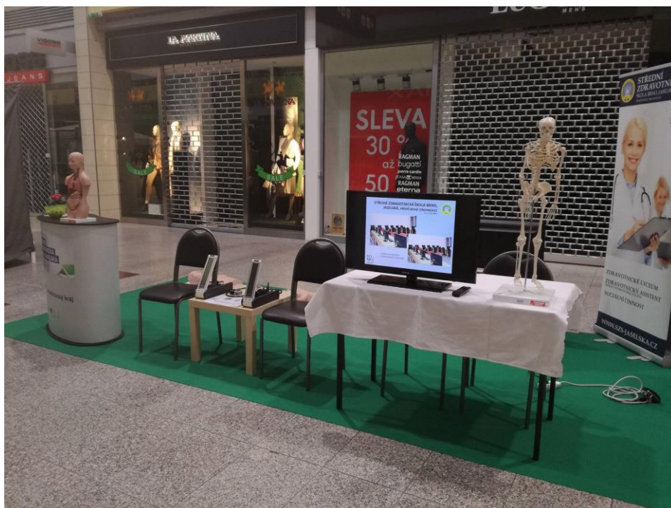
Stánek naší školy SZŠ Jaselská