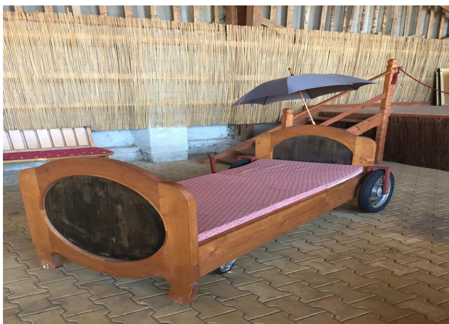
Ranč Šimona Pláničky – postel babičky Škopkové

Samotné centrum Hořtic mě ale příjemně překvapilo – téměř vše vypadalo jako ve filmech. Samozřejmě za 25 let došlo k určitým změnám (zámek má červenou fasádu, stromy