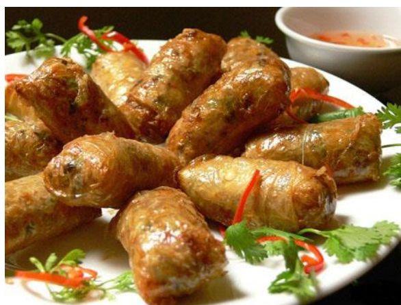
Takhle by měly vypadat klasické jarní závitky

5 polévkových lžic kvalitní rybí omáčky 2 polévkové lžice cukru 1 polévková lžice octa 1/2 polévkové lžice citronové šťávy z 1 citronu a nalijeme do půl misky horkou vodu chilli paprička a pepř