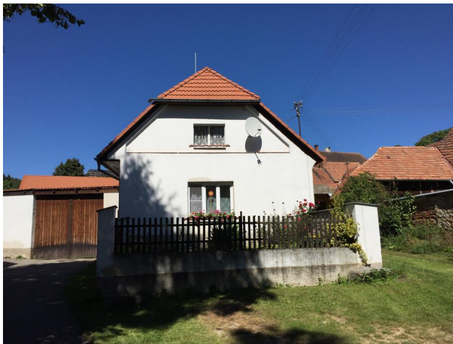
Dům Škopkových (bohužel jsem se nemohl podívat na slavný dvorek, kde stála babiččina postel – nový majitel postavil ve vchodu vysokou zeď a dřevěnou bránu)