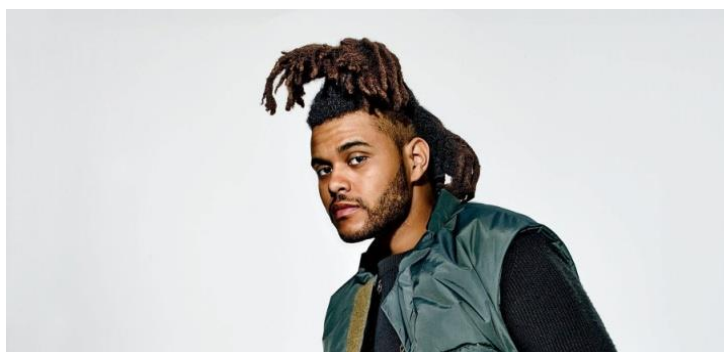
Abel Makkonen Tesfaye, známý jako The Weeknd

V průběhu roku 2016 ovládl song Starboy první místa téměř všech hitparád. Ať člověk chce nebo ne, minimálně refrén se mu dostane do hlavy na dost dlouhou dobu. Pojdme se ale podívat, co tímto dílem The Weeknd posluchačům vzkazuje.