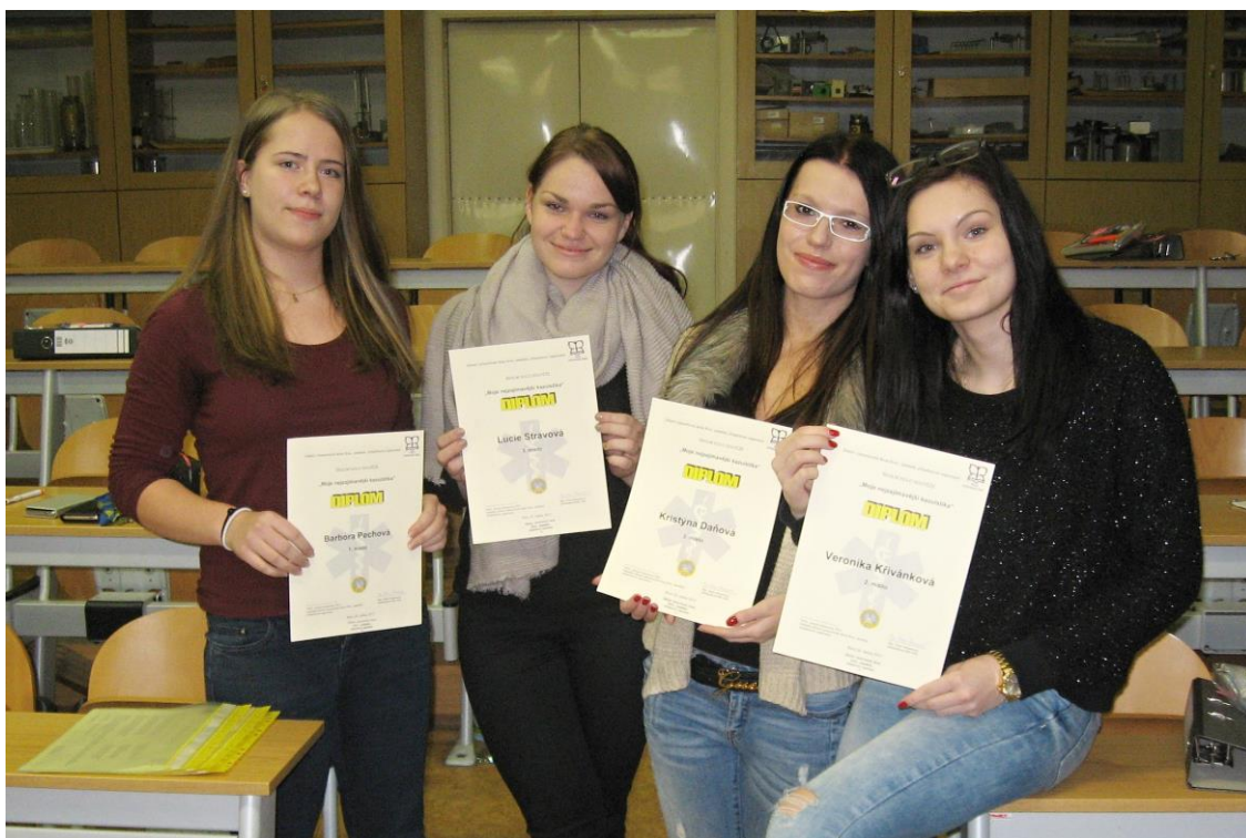
Přehled nejlépe hodnocených účastníků soutěže

Děkujeme všem žákům za velice pěkné a na vysoké odborné úrovni zpracované kazuistiky. Poděkování patří i všem odborným vyučujícím za odbornou pomoc a cenné rady žákům při zpracování kazuistik.