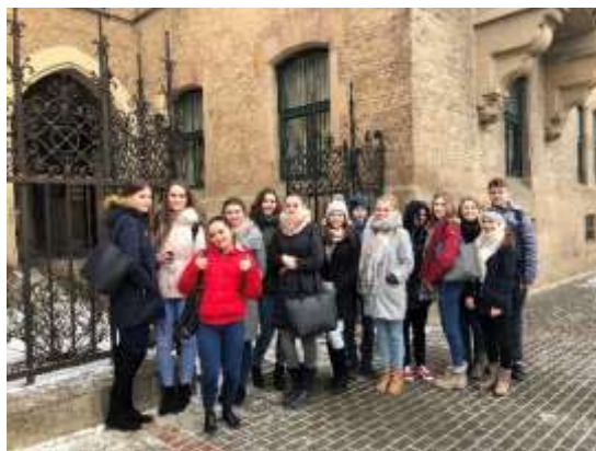
Třída 3. L

Po této úvodní čtvrt hodině si žáky vyzvedla lektorka, která byla rodilá mluvčí, a následovala výuková hodina „Lustiges Lernen“ neboli „Veselé učení“. Byla to hodina plná interaktivních her, videí, soutěží a zároveň komunikace v německém jazyce s rodilou Němkou.