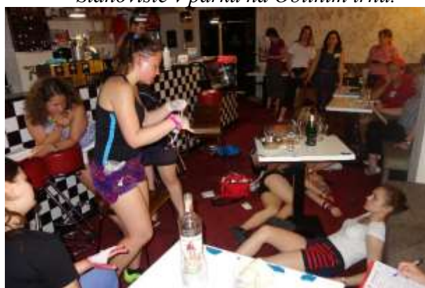
Stanoviště v restauraci.