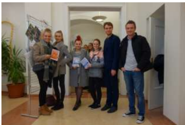
Redakce Jaselského kurýru, která se zúčastnila vyhlášení soutěže „O nejlepší středoškolský časopis roku 2018“.