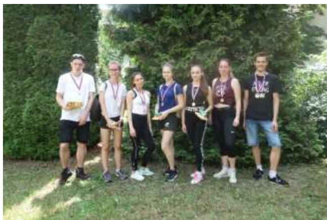
Vítězové jednotlivých disciplín.