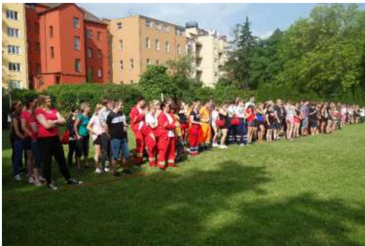
Nástup všech soutěžních týmů.