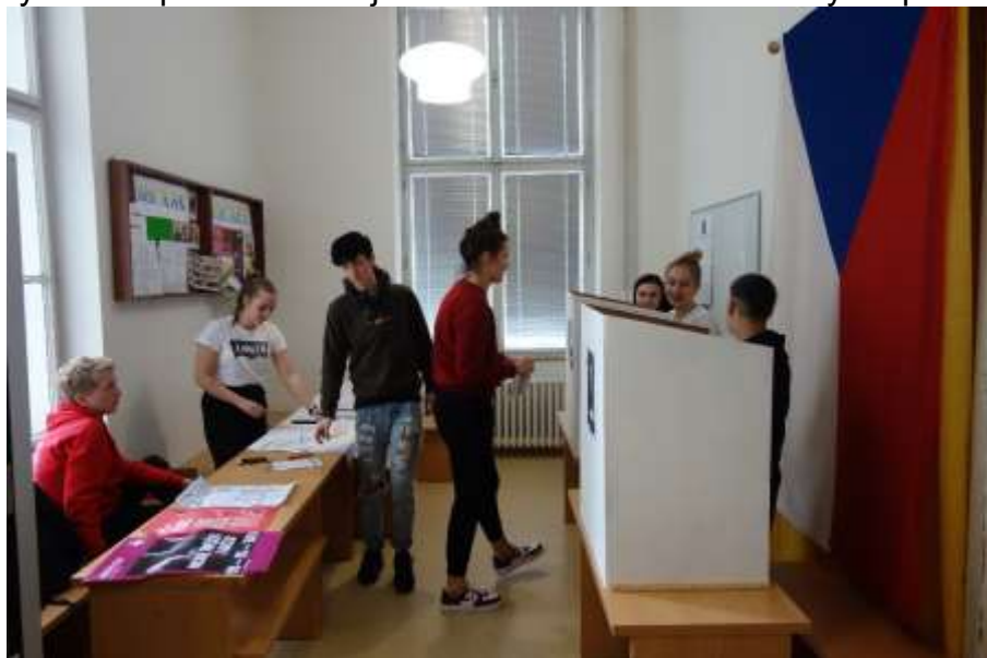
Žáci měli stejné podmínky jako u skutečných voleb.

Hlasování studentů do Evropského parlamentu organizuje projekt Jeden svět na školách společnosti Člověk v tísni. Školní volby věrně napodobují ty opravdové. Ve škole měli žáci volební místnost s hlasovacími lístky, pleťou a urnou. Do voleb se hlásili dobrovolně, jedinou podmínkou byl věk nad 15 let. Smyslem voleb bylo zvýšit zájem mladých lidí o politiku a veřejné dění a do budoucna tak zvýšit i počet prvovoličů.