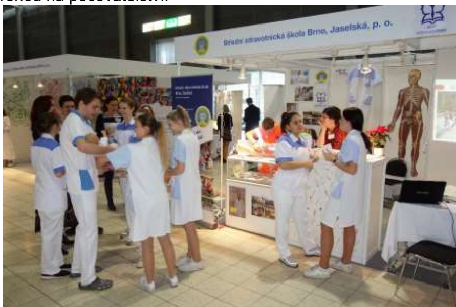
Stánek v pavilonu G1

Naše škola patří ke stálým a žádaným účastníkům Veletrhu středních škol. Od čtvrtečního rána stánek v pavilonu G1 „SZŠ Jaselské“ byl doslova v obležení. Žáci osmých později i devátých tříd měli opět velký zájem o obor praktická sestra a také o obor zdravotnické lyceum. Pomaturitní studium i obor sociální činnost měly také svoje zájemce. Obor sociální činnost je oborem budoucnosti a v následujícím roce naše škola otvírá opět třídu sociální činnosti zaměřenou na pečovatelství.