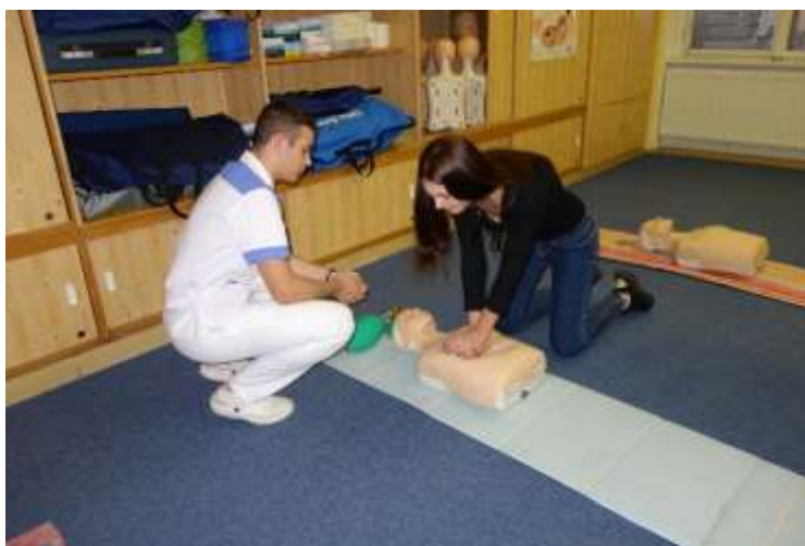
Prohlídka odborné učebny.

Prohlídka končila opět v přízemí, kde návštěvníci odevzdali vyplněný anketní lístek a kvíz. Řešitelé kvízu obdrželi malou sladkou odměnu a věcný dárek dle svého výběru. Někteří návštěvníci nám napsali vzkaz do knihy návštěv.