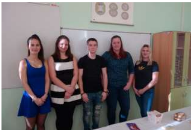
Účastníci soutěže Den psychologie.

Dne 18. února 2019 proběhlo školní kolo 14. ročníku psychologické olympiády Den psychologie na téma: Síla okamžiku. Školního kola se zúčastnilo 6 žáků z třetích ročníků oborů zdravotnický asistent a zdravotnické lyceum. Žákyně, které obsadily 1. a 2. místo, budou školu reprezentovat v krajském kole 12. března 2019.