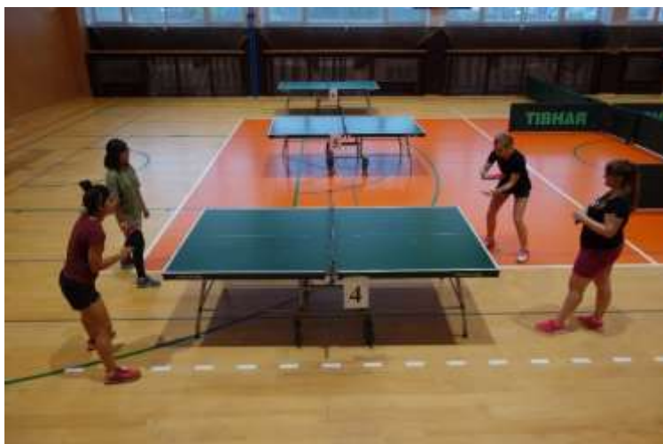
Děvčata ze 3. B svedla velkou bitvu o první místo.