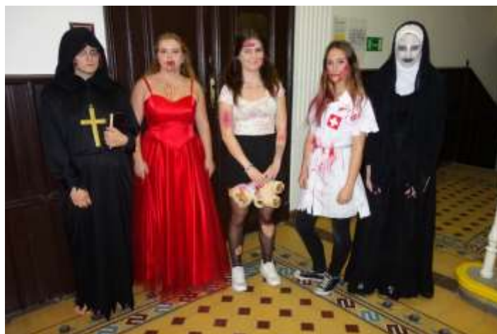
Pět nejlepších halloweenských masek.