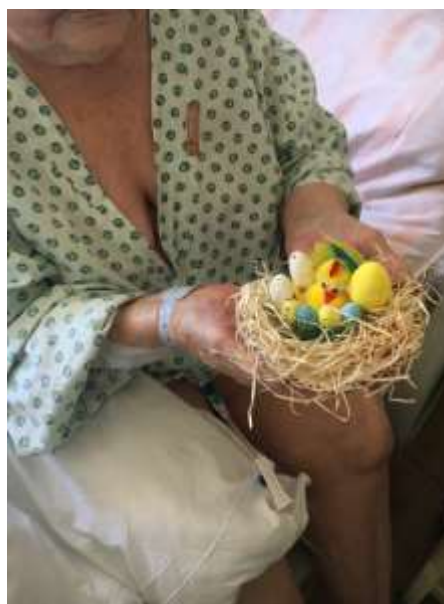
Velikonoční výrobky, které potěšily nemocné a ozdobily jejich pokoje.