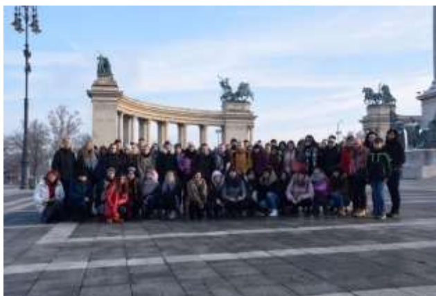
Společné foto všech výletníků.

Druhý den jsme se přesunuli do oblasti Varosliget (Městský sad). Následovala projížďka nejstarším metrem v Evropě a poté polední přesun autobusem na Hradní vrch. Dále pak procházka po oblasti Budínského vrchu, prohlídka Rybářské bašty, kdo stihl chrám sv. Matyáše, prohlídka starobyklých uliček. Nakonec návštěva rozsáhlého Labyrintu, kde jsme si to všichni užili.