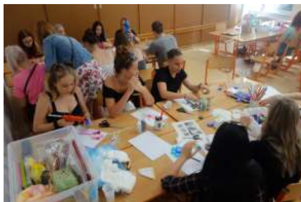
Žáci vyráběli z PET lahví různé dekorační předměty.

Dne 26. června 2019 se uskutečnil poslední projektový den v tomto školním roce, který měl za cíl upozornit na obrovské zatížení planety plasty a hledat možnosti a způsoby, jak plasty efektivně využít.