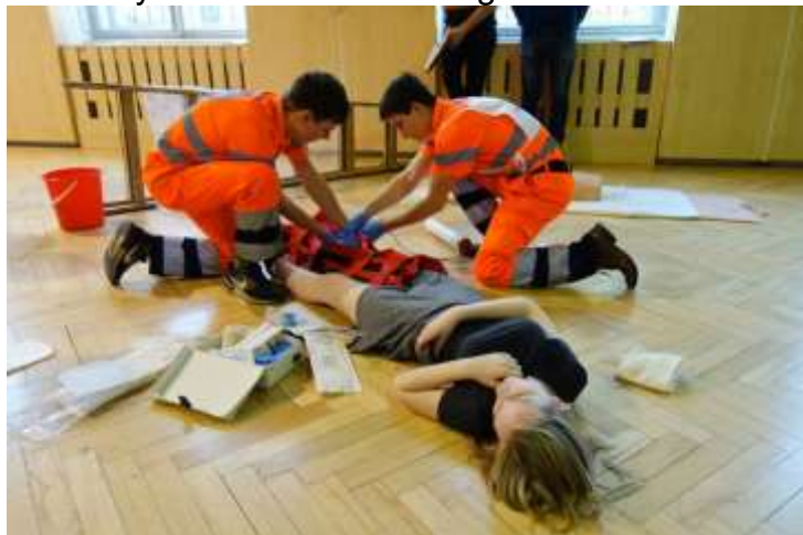
Tým záchranářů 3. B

Dne 20. března 2019 na naší škole proběhlo školní kolo soutěže v první pomoci. Soutěžila tříčlenná družstva druhých a třetích ročníků oboru zdravotnický asistent a zdravotnické lyceum. Soutěžilo celkem 9 družstev. Soutěž probíhala ve dvou částech – teoretická a praktická část. V teoretické části vyplňovala soutěžní družstva test o 15 otázkách. V praktické části soutěžní družstva předvedla poskytnutí první pomoci na konkrétní modelové situaci např. KPR, ošetření otevřené zlomeniny, otevřený pneumotorax, ošetření popálenin a jiné. Soutěžící byli rozděleni na 2 kategorie.