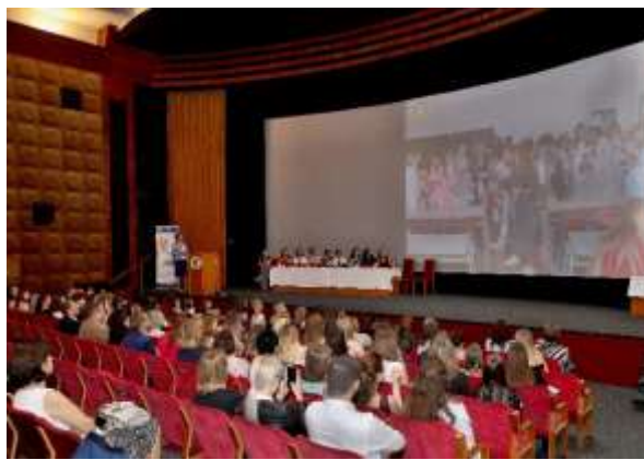
Slavnostní předávání maturitních vysvědčení.