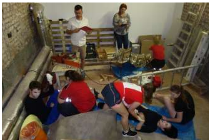
Stanoviště ve školním sklepě.