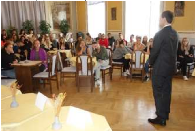
Přednáška o možnostech studia na vysokých školách.

Ve středu dne 10. října 2018 se ve Dvoraně Střední zdravotnické školy Brno, Jaselská, příspěvkové organizace konala přednáška pro maturanty „Jak si vybrat a dostat se na VŠ“. Přednášejícím byl zástupce z agentury Sokrates. Tato agentura je akreditovanou institucí MŠMT a specializuje se na přípravu žáků k přijímacím zkouškám na vysoké školy v rámci nultých ročníků, resp. připravuje žáky na tzv. národní srovnávací zkoušky (dále NSZ).