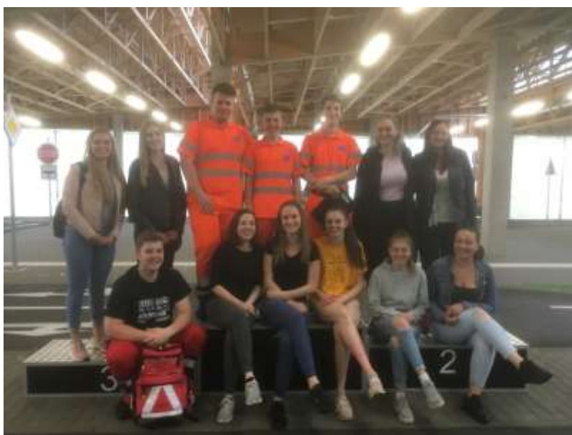
Žáci na dopravním hřišti v Brně – Pisárkách.

Soutěže se zúčastnilo 16 týmů po 4 soutěžících ve věkovém rozmezí 10–16 let. Týmy závodily v několika disciplínách a nás se týkala disciplína Zásady poskytování první pomoci. Úkolem našich žáků bylo v první řadě namaskovat modely s vybraným zraněním, např. zlomenina nebo krvácení, dále zahrát situace vybraného zranění. Roli hodnotitelů poskytnuté první pomoci dostali žáci 3. B a žáci 3. L. Hlavním koordinátorem hodnotitelů byl žák 3. B.