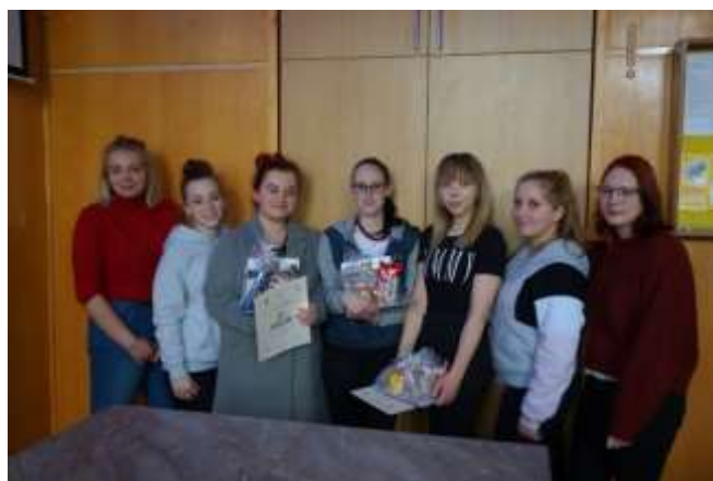
Vítězky soutěže v ošetřovatelství s dalšími účastnicemi.

Vítězka školního kola žákyně třídy 4. A ZA bude reprezentovat naši školu ve Zlíně na XV. Festivalu ošetřovatelských kasuistik dne 27. března 2019.