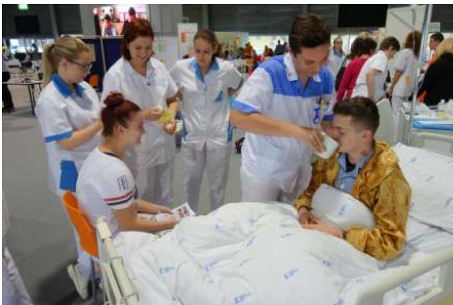
Improvizované nemocniční lůžko na stanovišti v pavilonu G2.