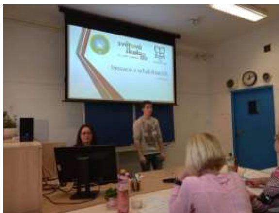
Žák prezentuje v Praze svoji práci a zároveň reprezentuje naši školu.

Žák třídy 3. B ZA se umístil na prvním místě s velkou pochvalou poroty za prezentaci a velmi pěkný přístup k pacientovi, který svými výbornými znalostmi dané problematiky jen potvrdil. Gratulujeme a děkujeme za vzornou reprezentaci školy!