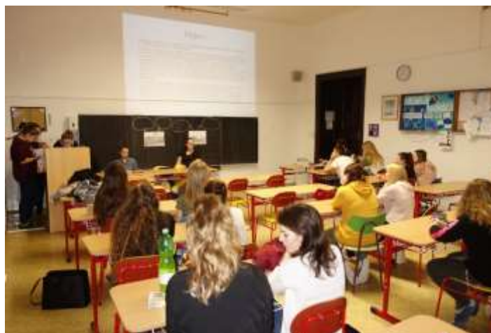
Žáci si nachystali prezentace pro své spolužáky.

Znalosti o problematice genderu budou zpracovány z dotazníkového šetření, které probíhalo vždy na začátku každé aktivity členy Světové školy. Na náš den zdraví pak naváže panelová diskuse v dubnu 2019, kde nám opět budou partnery neziskové organizace.