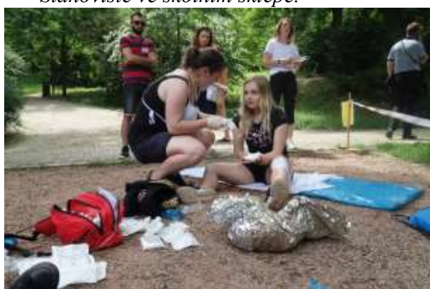
Stanoviště v parku na Špilberku.