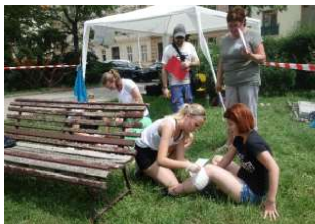
Stanoviště v parku na Obilním trhu.