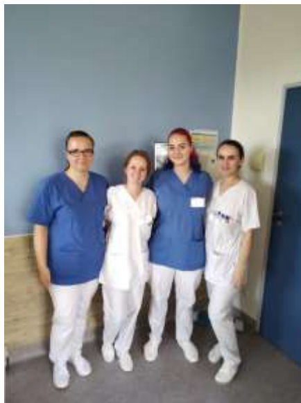
Žákyně v pracovním.

Žáci načerpali během stáže spoustu nových zkušeností, seznámili se s možnostmi práce v jiné zemi a navštívili nevýznamnější pamětihodnosti německé metropole. Po ukončení stáže obdrželi žáci certifikát stáže.