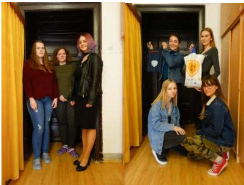
Žáci, kteří se zapojili do „srdíčkových dnů“.

Do prodeje sbírkových předmětů se zapojilo 15 dvojic žáků ze tříd oboru zdravotnický asistent, sociální činnost a zdravotnické lyceum. Předběžná finanční částka činí cca 9000,- Kč. Poděkování patří všem, kteří se sbírkové akce zúčastnili a finančně přispěli potřebným dětem.