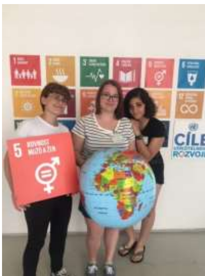
Děvčata z 2. L reprezentovala naši školu.