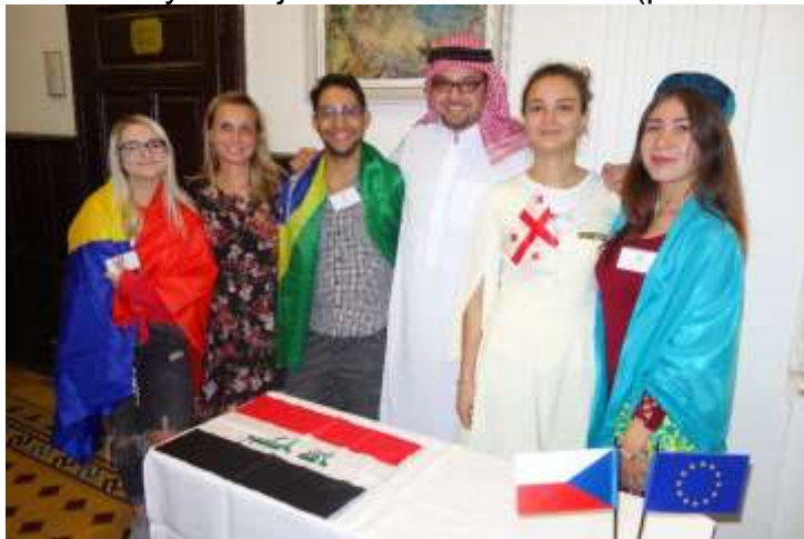
Studenti představovali také svou kuchyni, národní kroje a tance.

Vizí projektu je tolerance a příznivé společné soužití české společnosti s různými kulturami a národy a to na základě jejich porozumění a omezení předsudků a stereotypů. Díky multikulturní atmosféře vyvolané zahraničními stážisty projekt oživuje výuku a zvyšuje zájem o studium mezi žáky a studenty a učí je nebát se odlišného. (převzato ze stránek AIESEC)