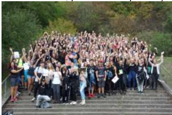
Společné foto všech prvních ročníků.

Dne 5. září 2018 se uskutečnil adaptační den pro první ročníky v Mariánském údolí. Akce se zúčastnilo asi 150 žáků a 10 pedagogů. Žáci s pedagogy hráli různé seznamovací hry. Dále žáci soutěžili v nejrůznějších sportovních soutěžích (Člověče nezlob se, biatlon, přetahování lanem, přísloví nebo pexeso).